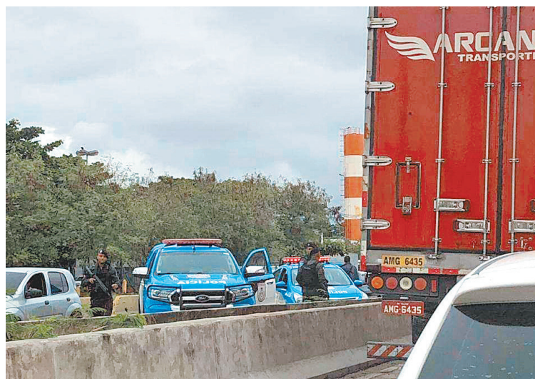
Caminhão trafegava na altura de Coelho Neto, no sentido Zona Oeste

A carga foi recuperada intacta e o motorista estava ileso. Segundo informações, os criminosos abordaram a vítima na BR-116 (Rodovia Presidente Dutra). A ocorrência foi encaminhada para a 27ª DP (Vicente de Carvalho).