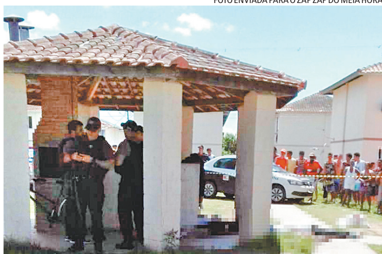
Em março do ano passado, cinco jovens foram mortos no condomínio

O menino foi socorrido e levado para o Hospital Municipal Conde Modesto Leal, também em Maricá. De acordo com a direção da unidade, a criança foi atingida no braço e no tórax e precisou ser transferida para o Hospital Estadual Alberto Torres, em São Gonçalo. Até o fechamento desta edição, seu estado de saúde era considerado estável.