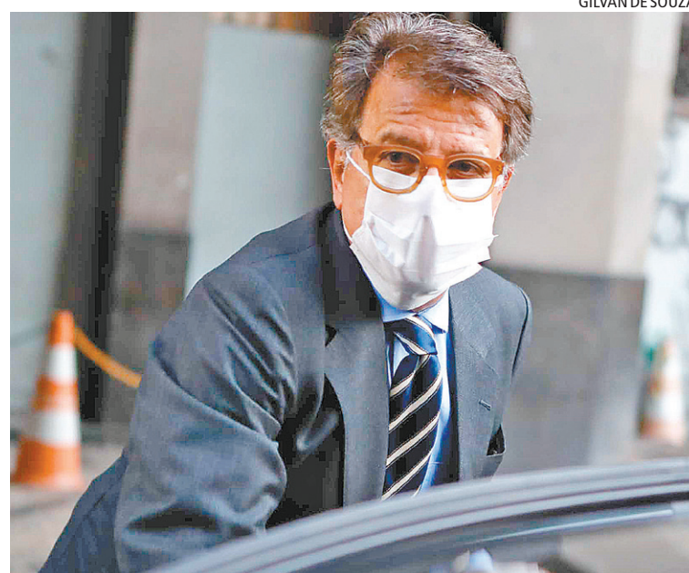
GILVAN DE SOUZA

Marinho ainda falou sobre ameaças recebidas e de um pedido de investigação sobre possível devassa em suas contas bancárias. “Não sei a origem dessas ameaças. Não tenho medo, pois quem toma a decisão que tomei precisa de coragem e ser casca grossa.”