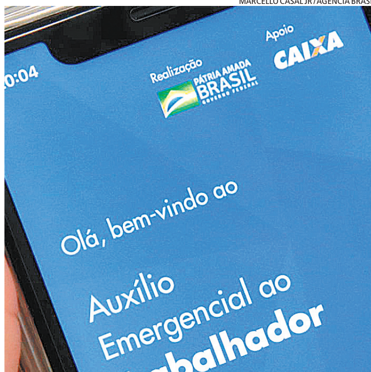
Governo estuda pagar nova cota do auxílio em três parcelas de R$ 200

Guedes diz que é preciso encontrar o equilíbrio “delicado” do auxílio na fase pós-isolamento. Ele descarta, porém, estender o auxílio por três meses no valor de R$ 600. “Não tem condições de estender tanto tempo”, afirma.