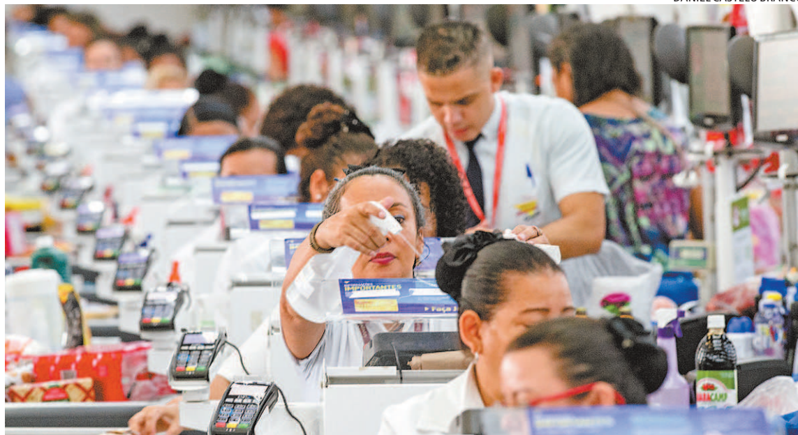
Entre as oportunidades de emprego oferecidas esta semana está para operador de supermercado

Já a Prefeitura do Rio, por meio da Secretaria Municipal de Desenvolvimento, Emprego e Inovação