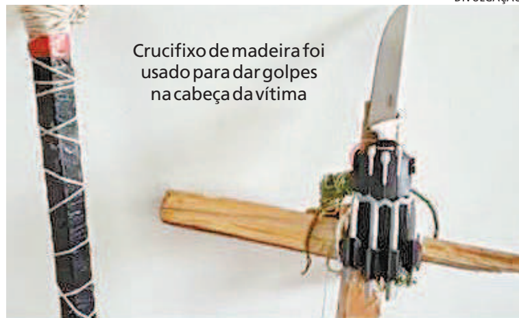
Crucifixo de madeira foi usado para dar golpes na cabeça da vítima