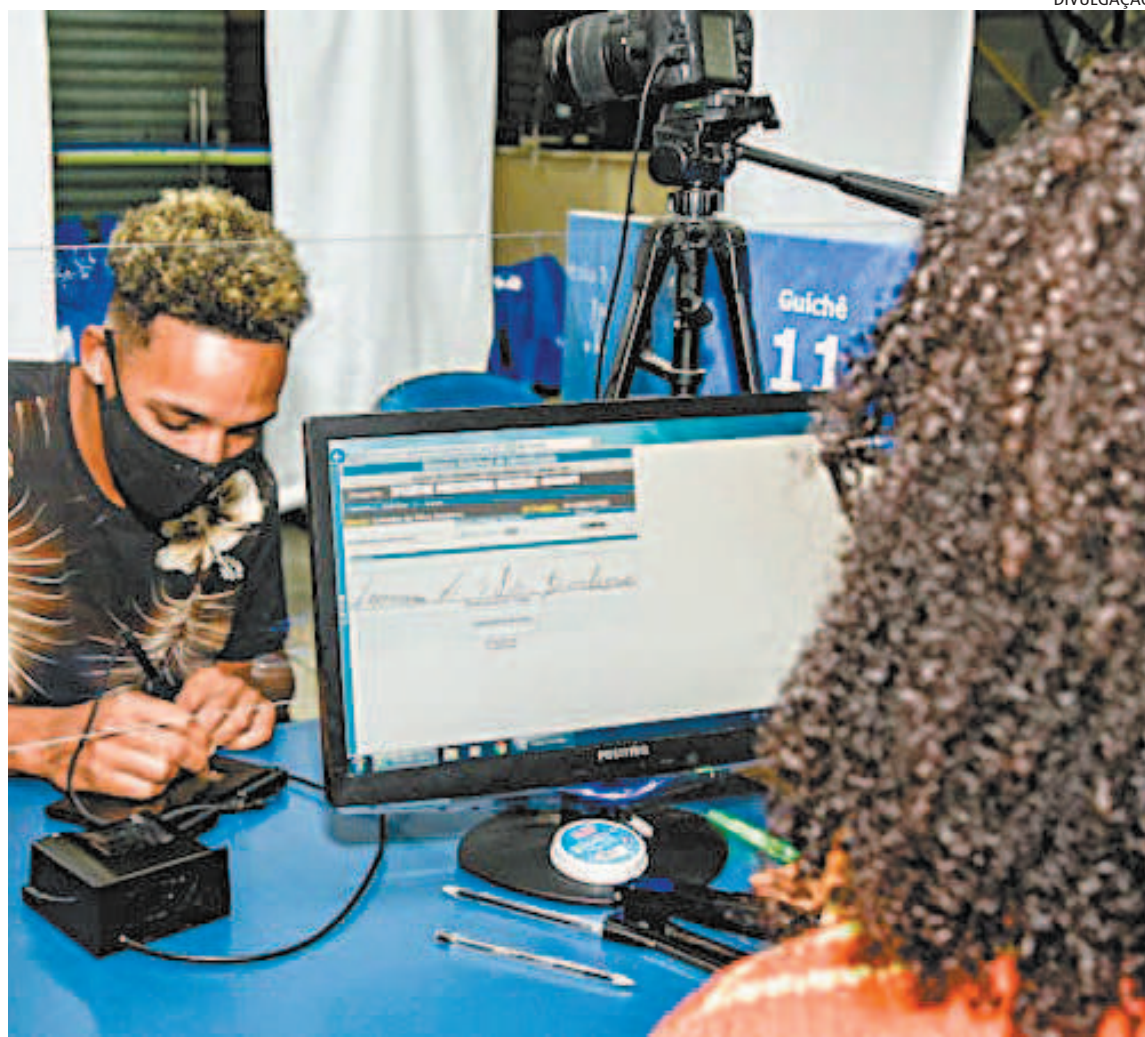
As 23 unidades do Detran reabertas ficam em seis bairros da capital e em outras 12 cidades

É importante não levar acompanhante para os postos, a não ser que seja extremamente necessário para o usuário do serviço. Durante a semana, as unidades funcionam das 8h às 17h. Nos sábados, dia dos mutirões, os trabalhos começam às 10h e terminam às 17h.