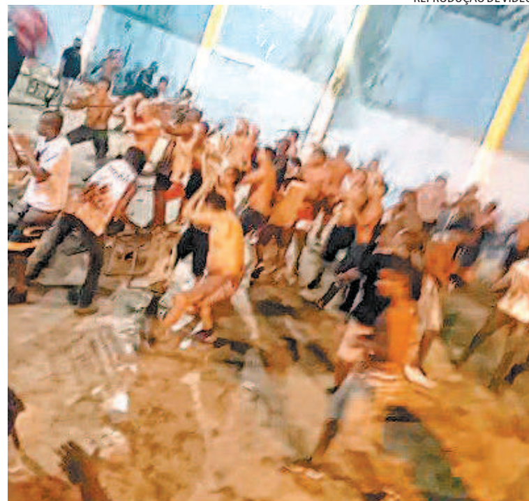
Vídeo flagra a pancadaria entre grupos no Esporte Club Sueca