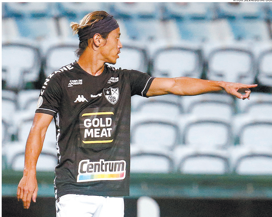
O meia Honda, sem prazo para seu retorno aos gramados, não enfrentará o Corinthians, domingo