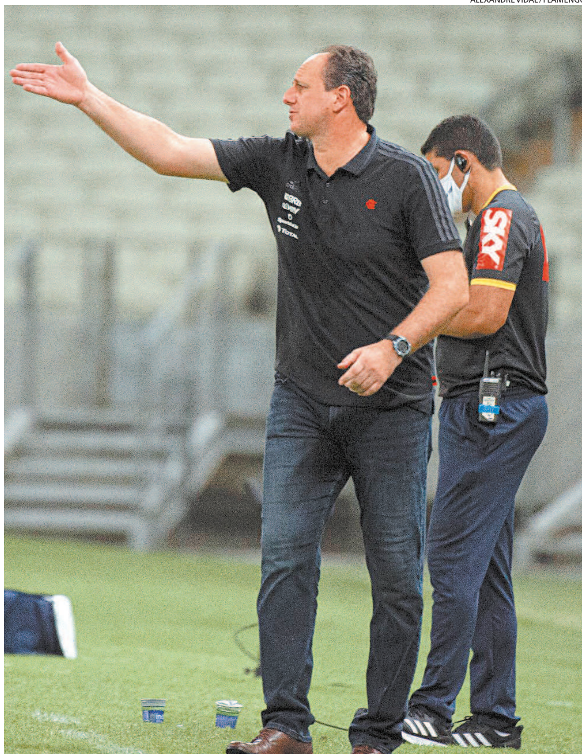
Rogério Ceni enfrentou o Fortaleza, seu ex-time, pela primeira vez como treinador do Flamengo

“É um prazer voltar e ver os caras que treinei. A dificuldade que o Flamengo enfrentou se deve ao sistema de três anos que foi montado. Acho que o Fortaleza pode chegar na Sul-Americana. Tem jogadores e futebol para isso”, finalizou.