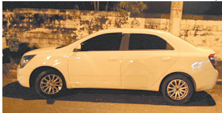
Motorista foi encontrado dentro do porta-malas de carro