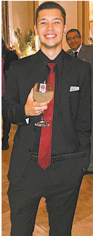
Marcos foi morto a tiros