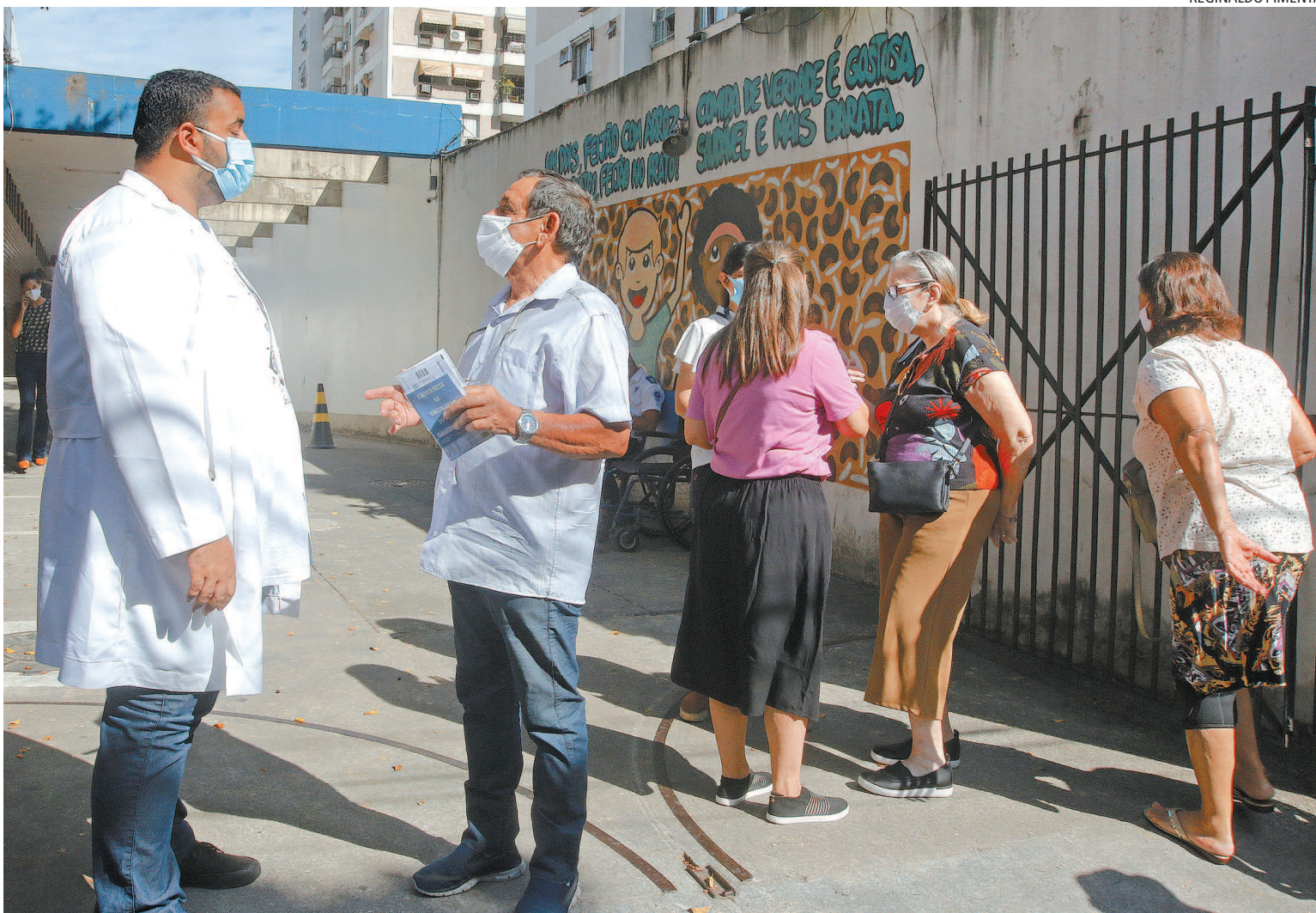
Por falta de vacinas para a primeira dose, idosos de 75 anos não puderam se imunizar ontem, como no posto Heitor Beltrão, na Tijuca

Entre as medidas anunciadas ontem se destacam: proibição da circulação em praças públicas entre 23h e 5h; proibição de boates, casas de espetáculo, rodas de samba e pistas de dança; drive-ins continuam; bares e restaurantes podem funcionar até 23h, com 50% da capacidade, mas cada município tem autonomia para regulamentar o horário nesse segmento; serviço de delivery, take away e drive-thru sem limitação de horário; funcionamento do comércio em horário escalonado; proibição da venda de bebidas alcoólicas em bancas de jornais; funcionamento de zoológicos, parques, museus, academias, casas de festa e recreação infantil com 50% da capacidade; ampliação do incentivo ao home office.