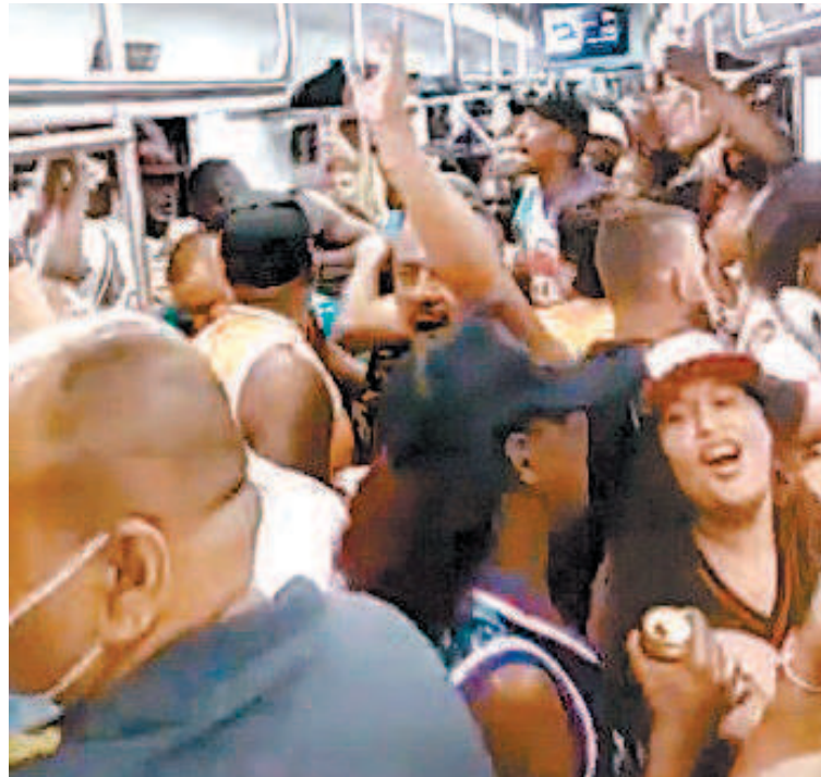
Vídeo mostra festa clandestina dentro de vagão do trem