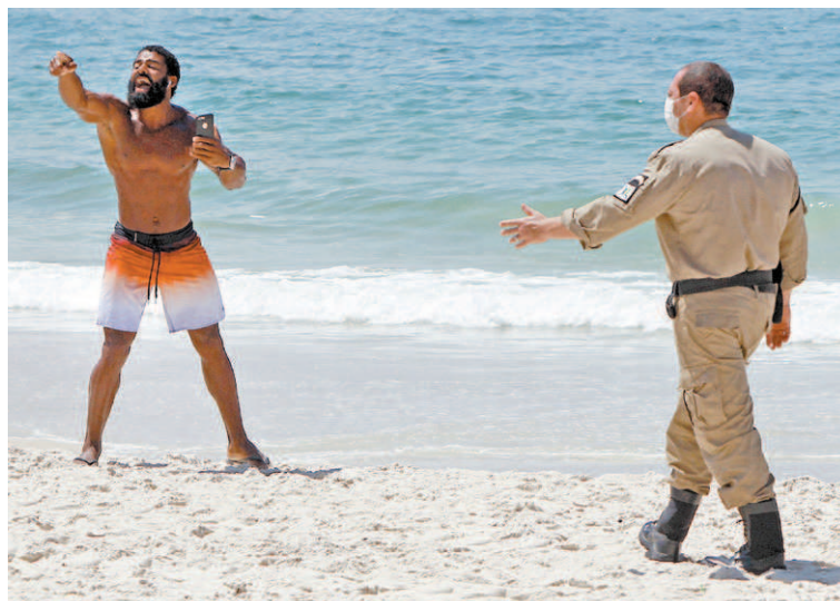
Mulher e homem discutem com guardas municipais na orla