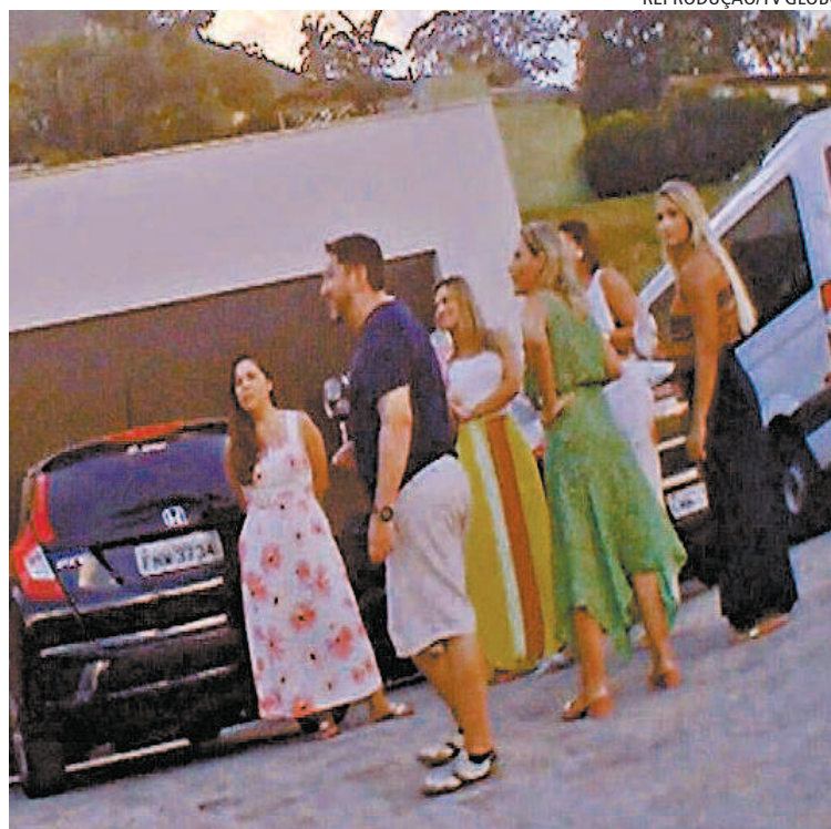
Sem máscaras, convidados se aglomeraram na casa do governador

“Foi um almoço com os meus familiares, pessoas que já convivem comigo diariamente. Realmente, alguns amigos acabaram aparecendo. E eu queria pedir desculpa, reconhecer o erro e pedir desculpa para toda a população fluminense”, afirmou Castro.