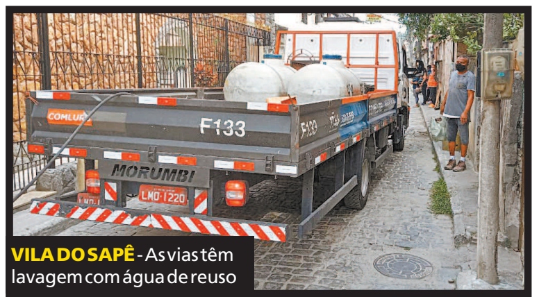
VILA DOSAPÊ - As vias têm lavagem com água de reuso