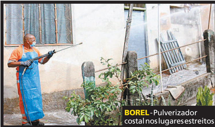
BOREL - Pulverizador costal nos lugares estreitos

A s comunidades do Rio já registraram mais de 15 mil casos de coronavírus, segundo o painel 'Coronavírus nas favelas', do Voz das Comunidades . Ontem, a Comlurb fez operação de sanitização para reduzir os riscos de contágio no Borel e no Complexo do Alemão, na Zona Norte, e na Vila do Sapê e Antares, na Zona Oeste.