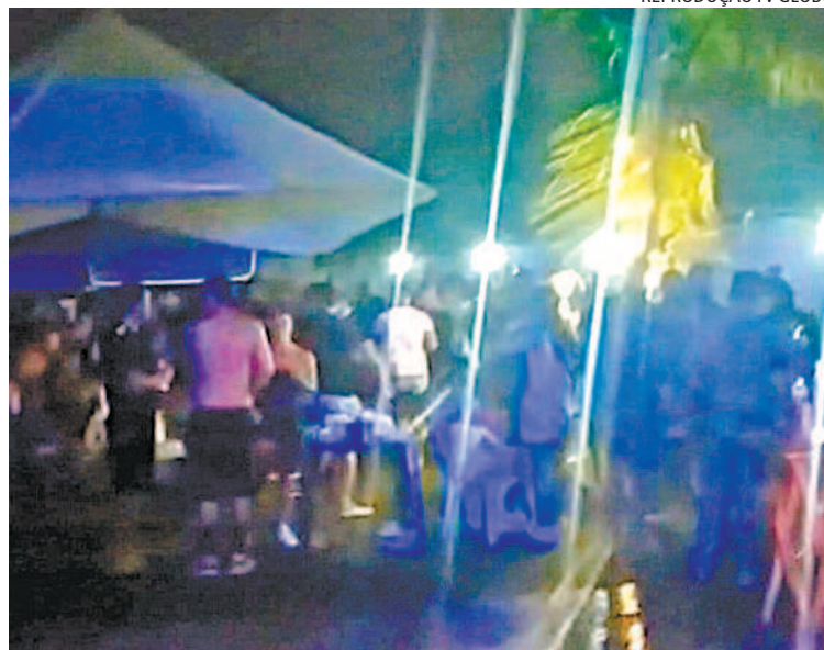
Fiscais agiram para acabar com um dos vários eventos irregulares

da Light, em Irajá. Moradores contaram que todos os quiosques funcionaram normalmente sem se preocuparem com qualquer tipo de fiscalização.