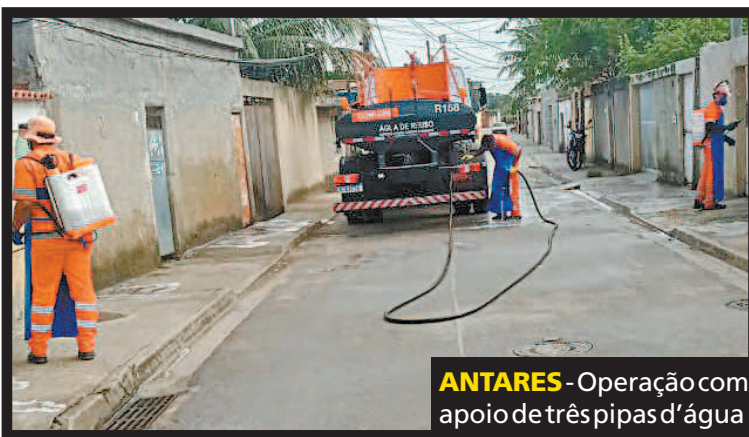
ANTARES - Operação com apoio de três pipas d'água