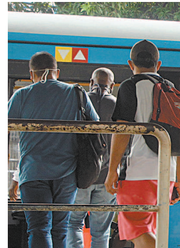
Estação de Madureira: muvuca