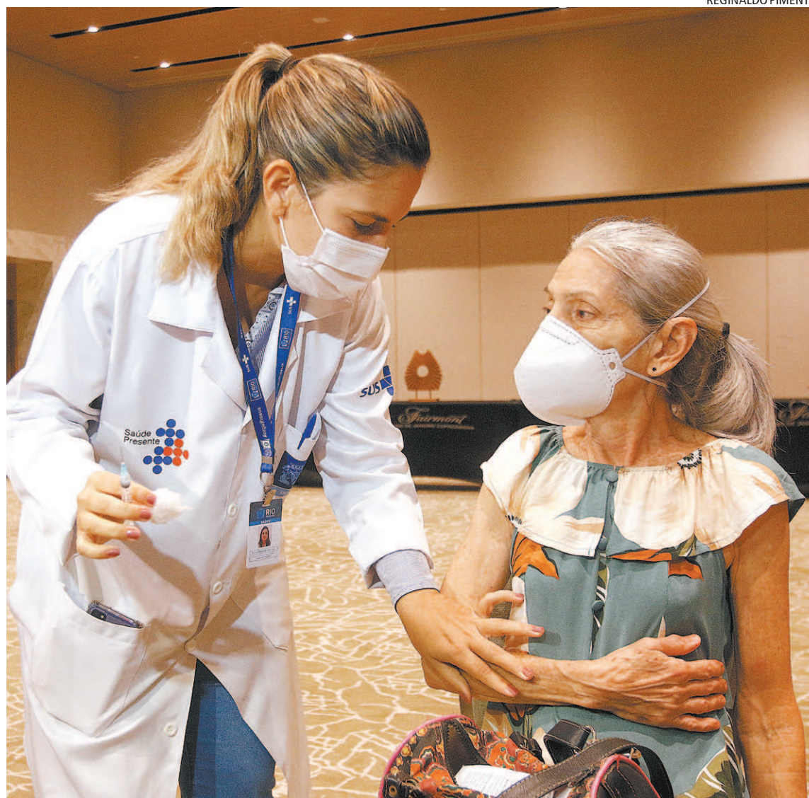
Idosa recebe dose da vacina. A partir do dia 4, o público-alvo volta a ser alternado entre homens e mulheres

Em nota, a prefeitura informou que, através da Secretaria Municipal de Saúde e Defesa Civil, está cumprindo mais uma etapa do Plano Nacional de Imunização (PNI) com a vacinação, escalonada por faixa etária, para evitar possíveis aglomerações. Ontem, os idosos de 65 anos ou mais receberam a primeira dose em quatro pontos de vacinação.