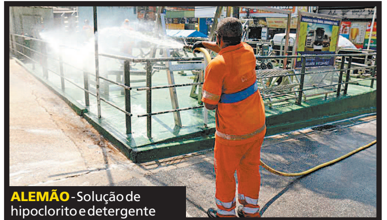
ALEMÃO - Solução de hipoclorito e detergente

Foram 24 garis, três pipas d'água, oito pulverizadores e uma varredeira. As vias também receberam lavagem com água de reuso. O primeiro ciclo desse trabalho teve início no dia 26 e irá alcançar 32 comunidades, de todas as regiões da cidade, até sábado.