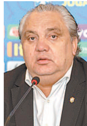
Branco tetracampeão mundial