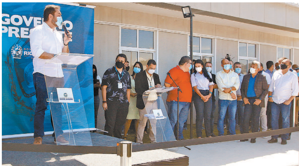
O governador em exercício Cláudio Castro na inauguração do Hospital Estadual Dr. Ricardo Cruz

Em um dos inúmeros discursos políticos, um dos convidados subiu ao palco e falou sem máscara ao lado do governador. Ao descer, o distraído resolveu, então, colocar o equipamento de proteção.