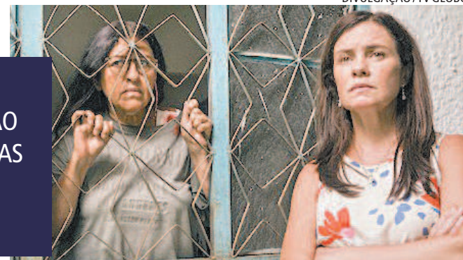
Lurdes é mantida em cativeiro por Thelma na novela

'AS REDES SOCIAIS ESTÃO MOVIMENTADAS COM A SAGA DE LURDES'