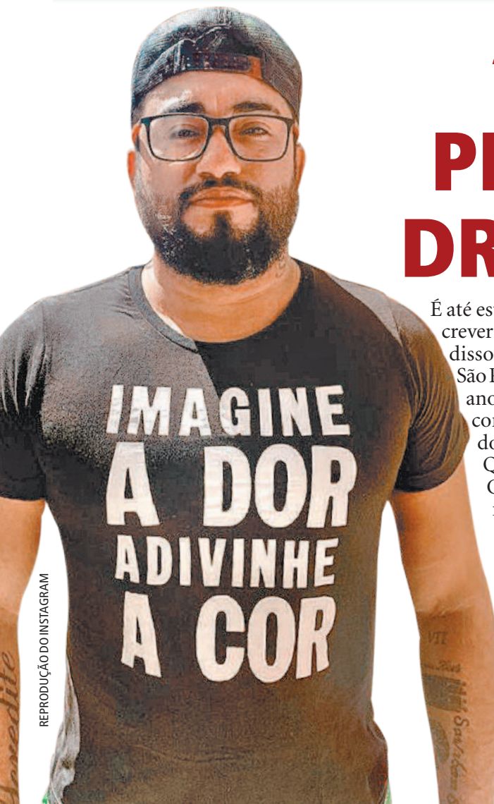
REPRODUÇÃO DO INSTAGRAM

É até estranho falar ou mesmo escrever 5,2 bilhões de reais. Apesar disso, esse é o valor que o Rio e São Paulo usaram em apenas um ano para reprimir o tráfico e o consumo de drogas, de acordo com o relatório "Drogas: Quanto Custa Proibir?", do Centro de Estudos de Segurança e Cidadania - CESeC.