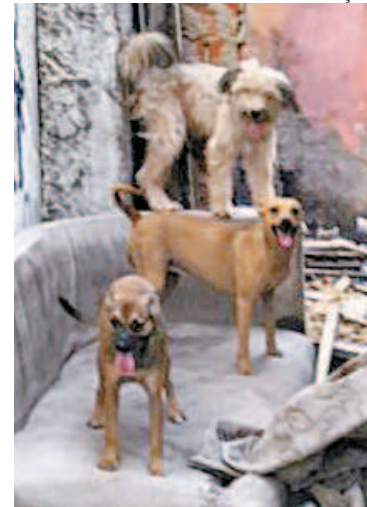
Sete animais foram resgatados