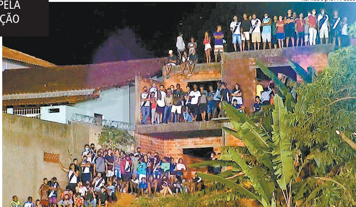
Torcedores do Vasco se aglomeram em obra ao lado do Almeidão. Polícia foi acionada e dispersou a galera

O CLUBE DE SÃO JANUÁRIO LEVOU R$ 1,7 MILHÃO DE BÔNUS PELA CLASSIFICAÇÃO