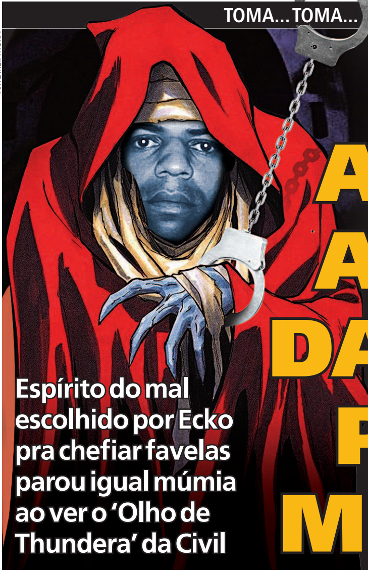
ARTE MEIA HORA