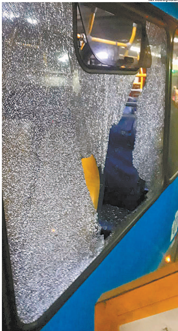
Problema detectado pela intervenção é a degradação da frota