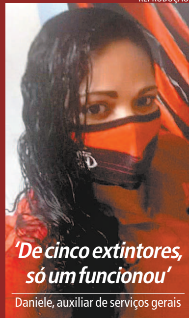
'De cinco extintores, só um funcionou'