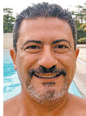
Tom Veiga: morto em 1º/11/2020