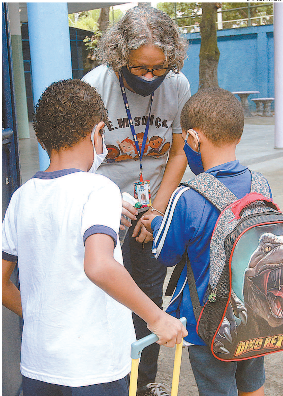
Alunos foram monitorados na porta das escolas no primeiro dia de volta às aulas no Município do Rio

O Poder Executivo regulamentará a norma por meio de decretos. "Atitudes inaceitáveis como a recusa ao uso de máscara e a participação em aglomerações festivas ou recreativas revela indiferença e negação à realidade que está posta: disseminação de um vírus severo e letal", declarou Pedro Ricardo.