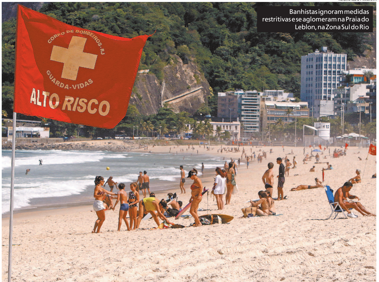
Banhistas ignoram medidas restritivas e se aglomeram na Praia do Leblon, na Zona Sul do Rio

Apesar da nova prorrogação das medidas restritivas contra a Covid-19, banhistas se aglomeravam nas areias da Praia do Leblon, na Zona Sul do Rio, ontem. Era possível ver diversas pessoas juntas e sem máscara nas areias da praia, na altura do Posto 11. Algumas tomavam banho de mar e outras pegavam sol.