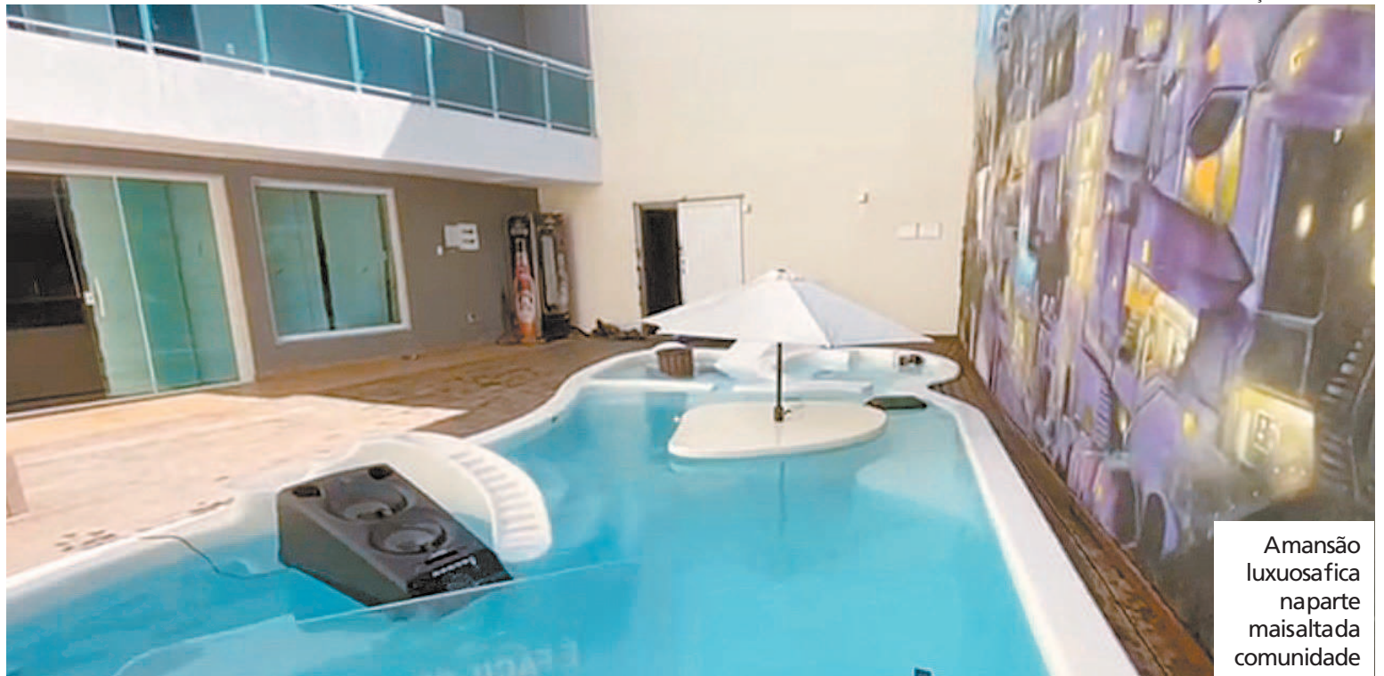
Amansão luxuosa fica na parte mais alta da comunidade