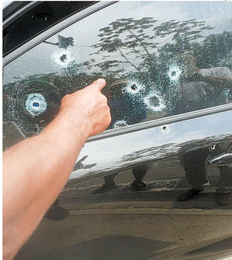
Homem assassinado teria ligação com o jogo do bicho na região