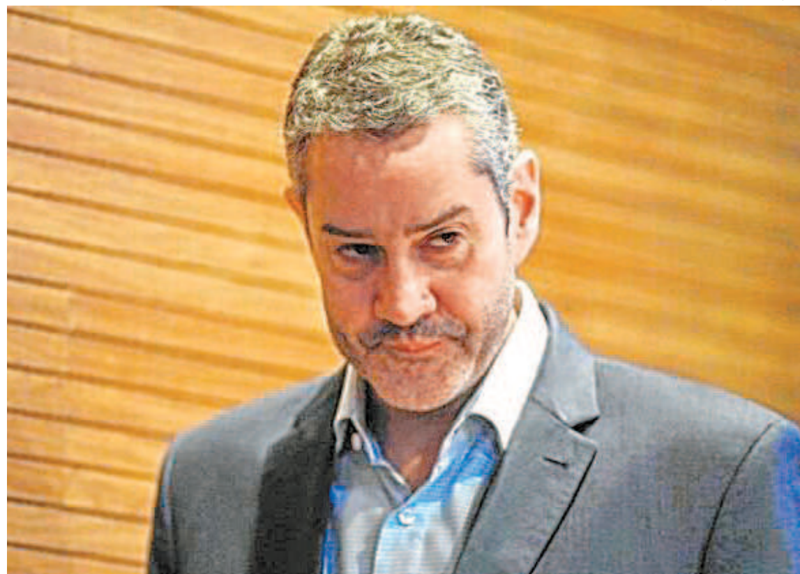
Afastado da CBF, Rogério Caboclo é acusado por assédio moral e sexual e fica ainda mais enroscado

Ednaldo deverá concluir o mandato de Caboclo até abril de 2023. O estatuto determina que eleições devem ser convocadas um ano antes disso: ou seja, entre abril de 2022 e abril de 2023 será escolhido o próximo presidente da CBF.