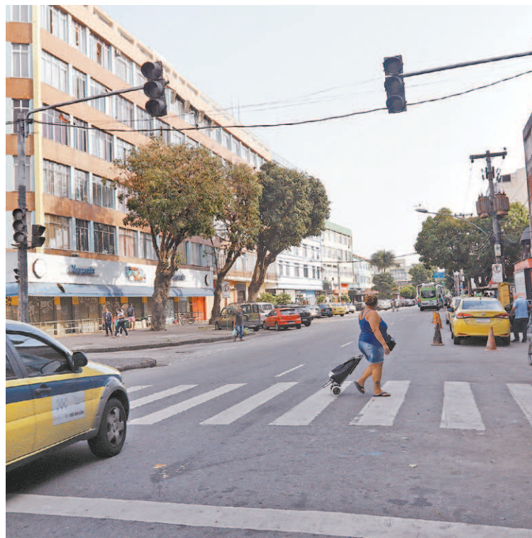
Atravessar vias sem sinalização virou uma missão muito perigosa

“Vocês estão vendo, ou seja, não é história de pescador. Todo dia tem acidente nesse ponto aqui”, completa do morador.