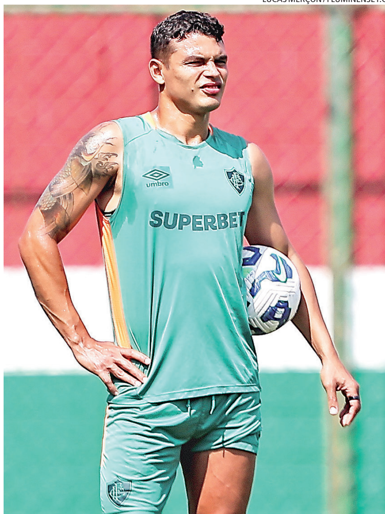
O zagueiro Thiago Silva é um dos líderes do elenco tricolor