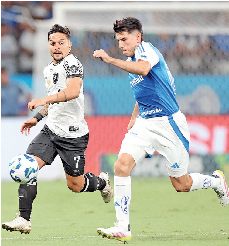
Botafogo teve um início de jogo ruim e melhorou na etapa final

COM A EXPULSÃO DE DAVID RICARDO, O BOTAFOGO NÃO TERÁ ZAGUEIROS PARA DOMINGO