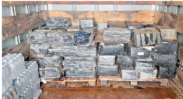
Material entorpecente estava escondido em carga de água mineral