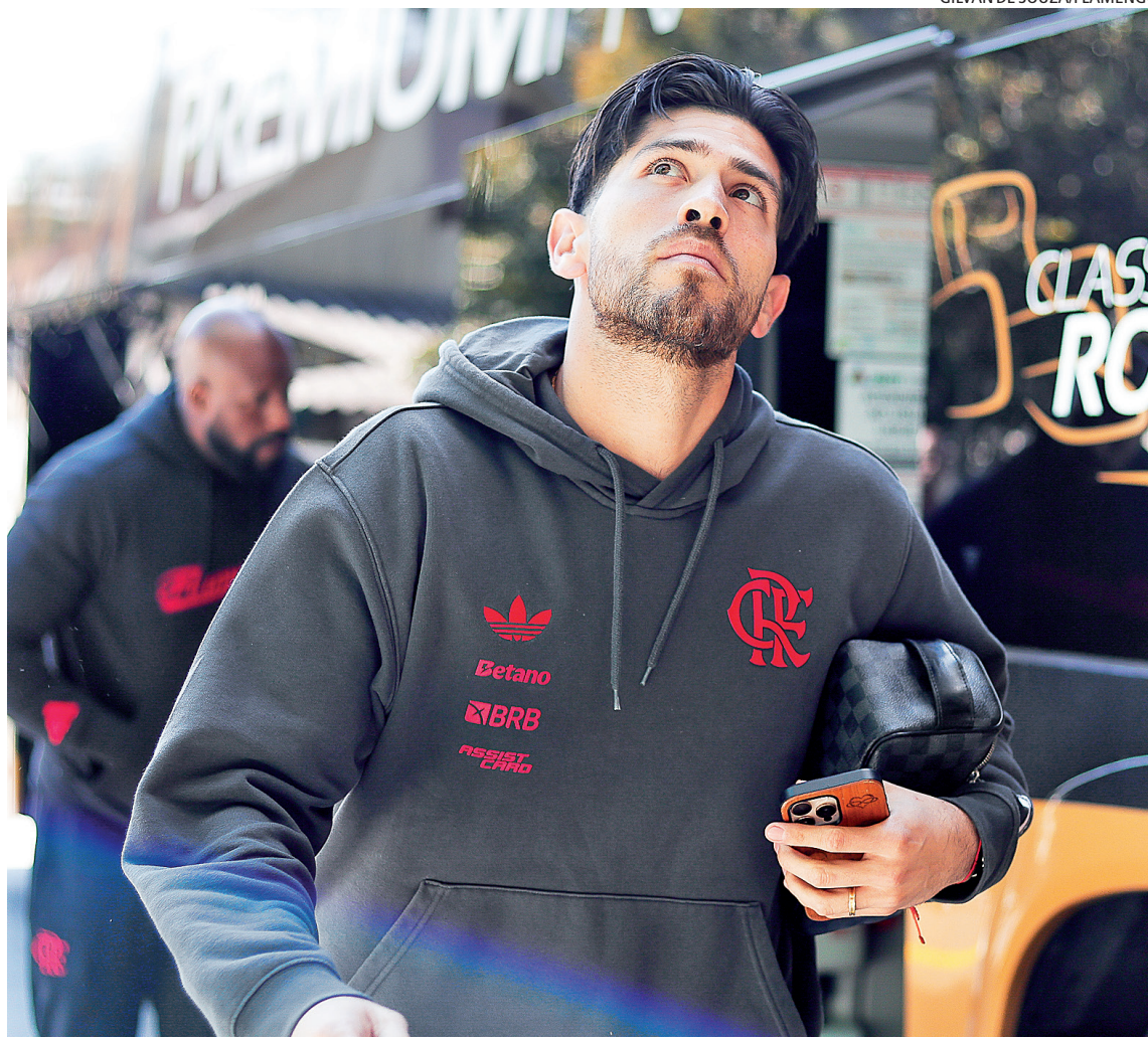
Após o enea, elenco principal do Fla viajará completo para a disputa do Intercontinental em Doha