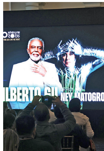
Gilberto Gil e Ney confirmados