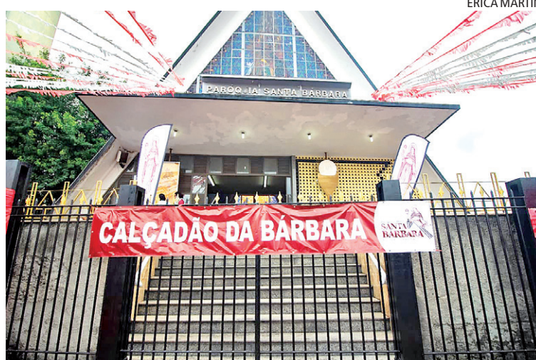
Fundada em 1957, em Rocha Miranda, paróquia mantém tradição

A novidade desta edição foram as barracas de evangelização, onde fiéis puderam registrar testemunhos, fazer pedidos de oração, participar de desafios e levar brindes como medalhinhas, terços, chaveiros e fitas.