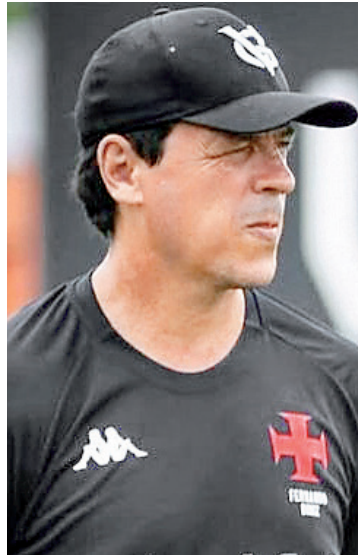
Diniz pode mexer no time

tem relevância para o Cruz-Maltino. Ao mesmo tempo, o técnico Fernando Diniz se preocupa com o desgaste físico dos principais jogadores e