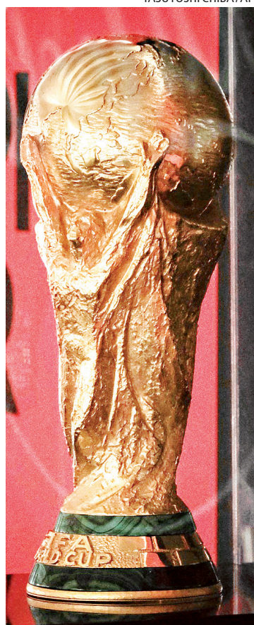
A tão sonhada taça da Copa