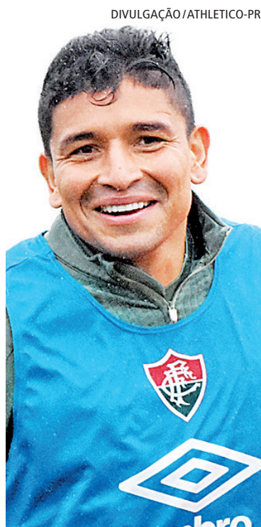
Pineida jogou no Flu em 2022

A polícia ainda investiga a motivação do atentado.