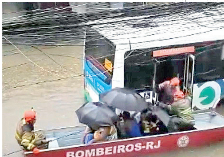
Passageiros precisaram ser resgatados no bote do Corpo de Bombeiros