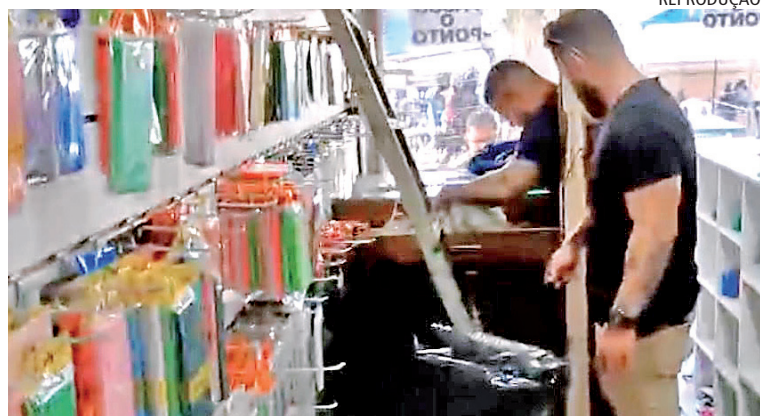
Estabelecimento vendia, em Santa Cruz, aparelhos celulares roubados