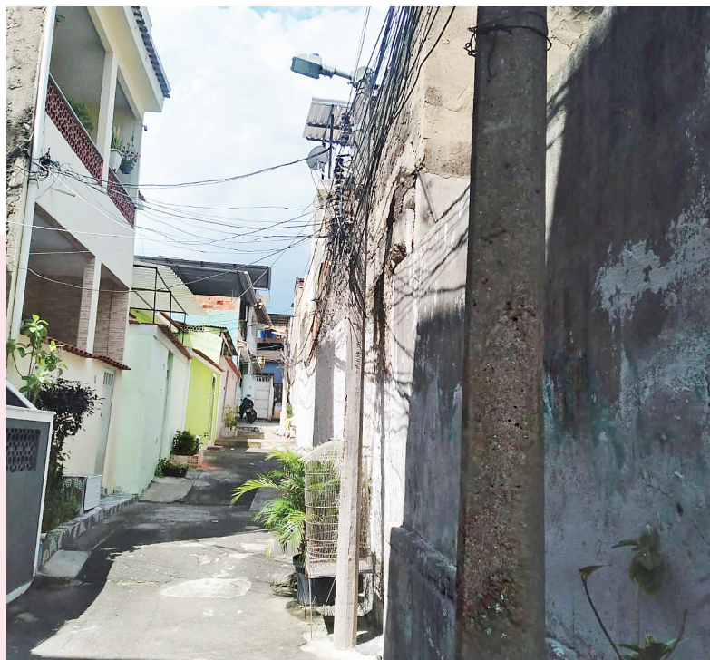
ENVIADO PELO ZAPZAP DO MEIA HORA

Gilson Salsa, Via ZapZap, o WhatsApp do Meia Hora