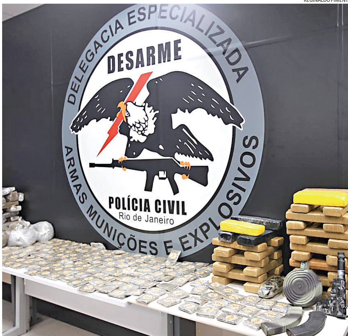
Apreensões foram levadas para a sede da Desarme, na Cidade da Polícia, na Zona Norte do Rio de Janeiro

Entre os presos estão um homem, apontado como um dos líderes do esquema de delivery de drogas, e uma mulher também investigada no inquérito. Um segundo homem foi detido em flagrante porque conduzia uma moto roubada e apresentou um documento falso. Os policiais apreenderam drogas, sendo uma grande quantidade de maconha e seus derivados, motos e um carro, modelo Toyota Hilux SW4, roubado.