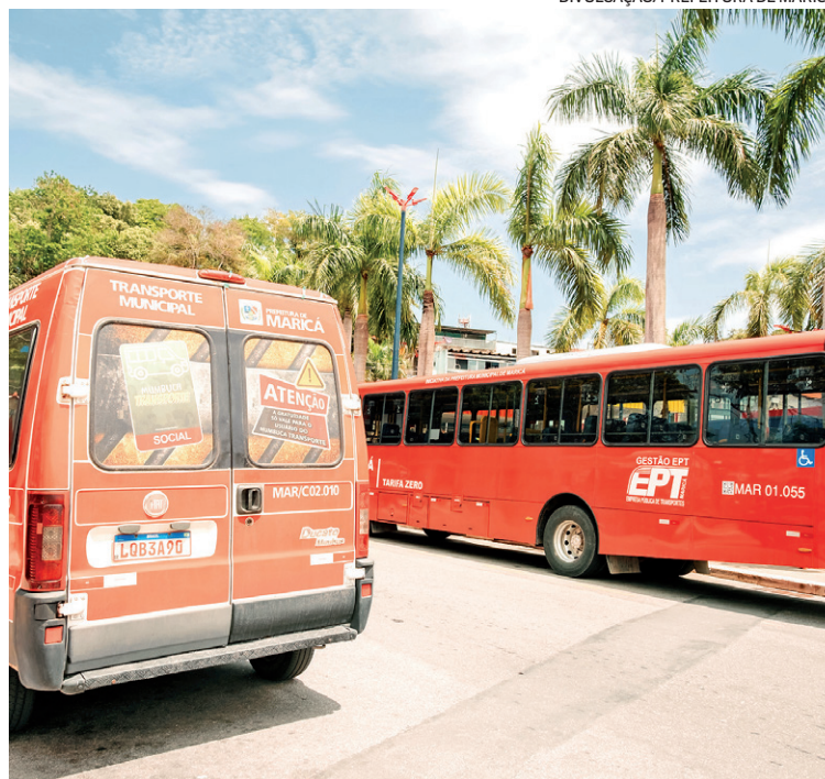
A medida amplia o alcance do transporte público em bairros distantes

A medida segue o modelo já consolidado com os ônibus Vermelhinhos, que circulam gratuitamente há 11 anos e se tornaram referência nacional e internacional em mobilidade urbana (Tallin, a capital da Estônia, implantou o modelo de Maricá depois de uma visita de representantes da cidade e da União Europeia ao município). A política pioneira garante economia