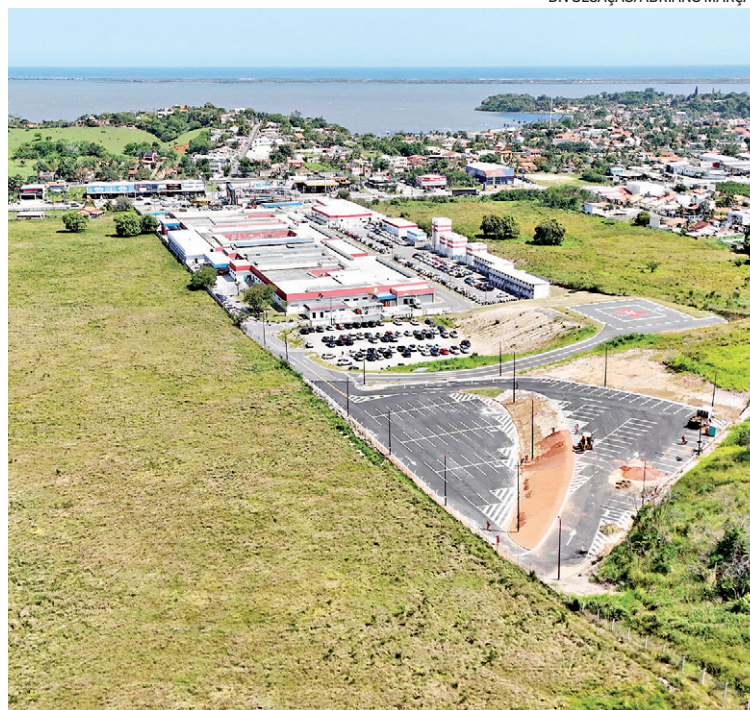
Aos poucos, a Cidade da Saúde vai ganhando corpo junto ao Che

ximadamente 122 pacientes que moram na cidade e hoje precisam se deslocar até outros municípios para realizar o tratamento. As principais ampliações e serviços da Cidade da Saúde contemplam cirurgia (ampliação da enfermaria cirúrgica para 30 leitos e duas novas salas cirúrgicas), área de imagem (qualificação do Centro de Imagem e Setor de Ressonância Magnética, com previsão média de 150 exames realizados por mês), ambulatorios e apoio (mais 5 consultórios ambulatoriais) e a ampliação da Central de Material e Esterilização (ampliação de engenharia clínica e um centro de reabilitação).