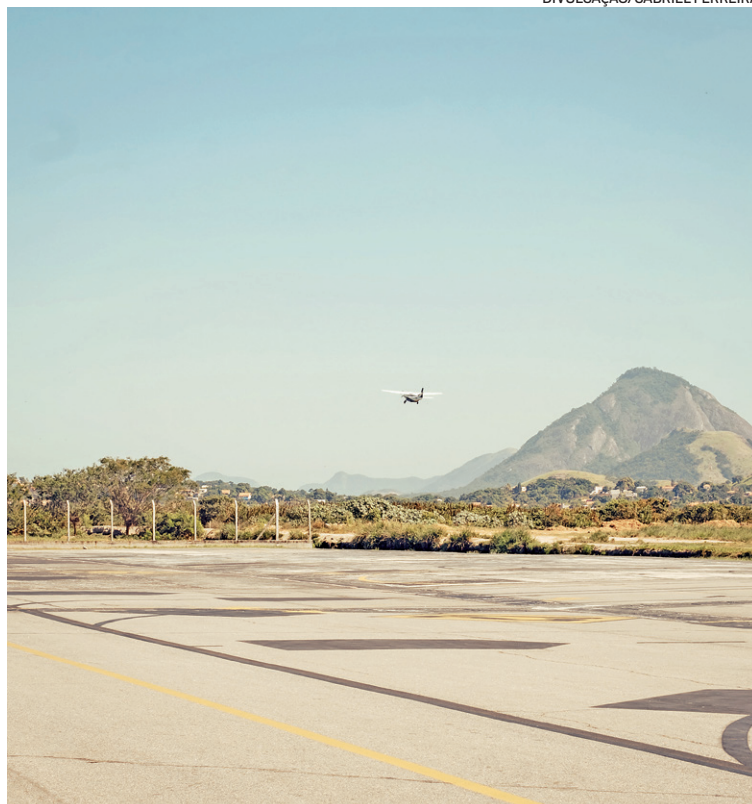
A ampliação da pista permitirá a operação de aeronaves maiores

to já superou 5.500 operações em 2025, transportando quase 130 mil passageiros. A projeção da Petrobras é a de fechar 2025 com 7.331 voos, levando mais de 152 mil trabalhadores para plataformas offshore. Até 2027, o número deve ultrapassar 10 mil voos anuais, com mais de 216 mil passageiros embarcando a partir da cidade.