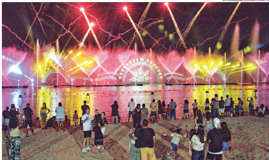
O espetáculo das Águas Dançantes em Araçatiba é um sucesso, já tendo atraído milhares de pessoas