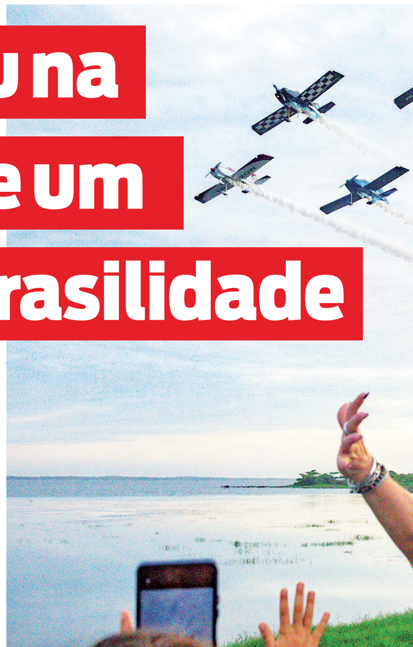
Por 20 minutos, os quatro aviões do Balé Aéreo desenharam figuras e fizeram

uma das atrações da programação do Natal da Brasilidade. Montado no Parque Nanci, oferece roda-gigante, carrinho bate-bate, pista de patinação no gelo, carrossel e outras atrações. A área gourmet conta com quiosques de restaurantes da cidade e cervejarias artesanais locais. A utilização dos brinquedos é gratuita, mas é necessário fazer agendamento pelo site natalbrasilidade.com.br .