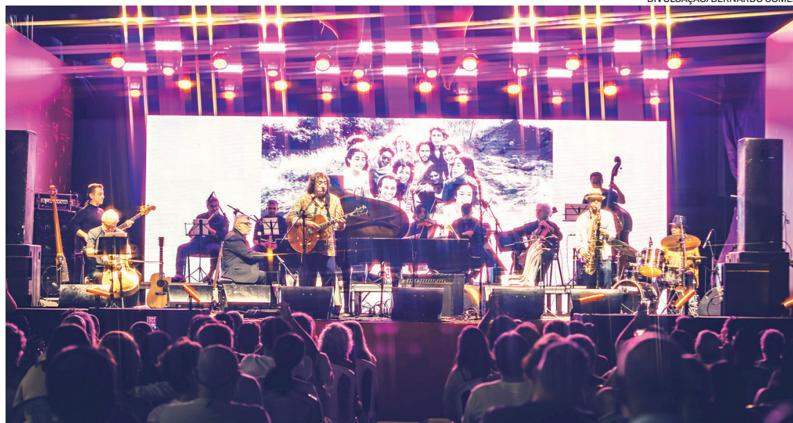
No show, o maestro Wagner Tiso celebrou seus 80 anos ao lado de Toninho Horta e outros ícones da MPB