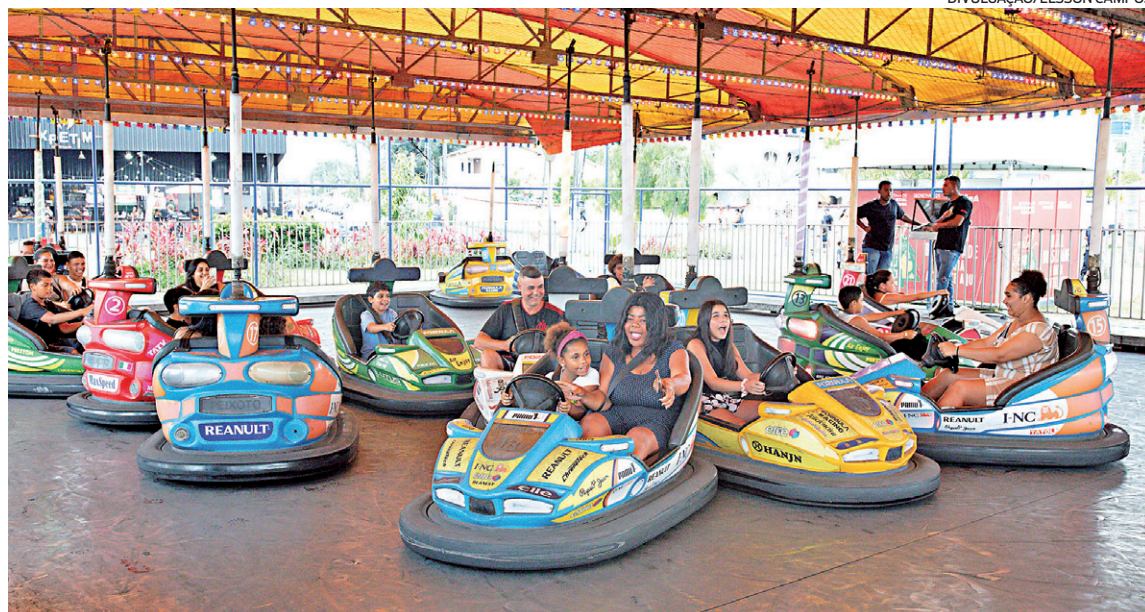
O parque de diversões no Parque Nanci tem atrações gratuitas, bastando para curtir a inscrição no site