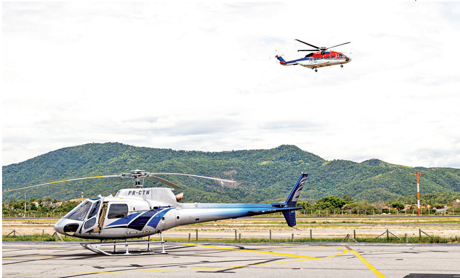
O programa Voar É Para Todos vai implantar uma escola de formação de pilotos e mecânicos no aeroporto via Passaporte Universitário

Atualmente com cerca de 600 voos mensais, o aeropor-