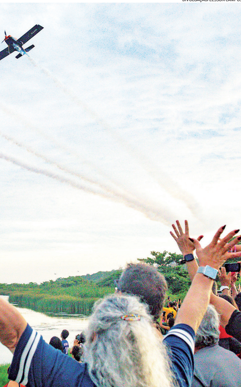
manobras sincronizadas sobre a multidão na orla do Parque Nanci