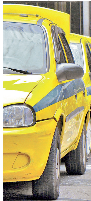
Lei revogada era da Câmara