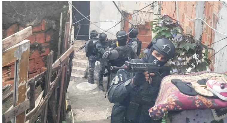
PM também atua no Morro da Fé e Sereno, no Complexo da Penha