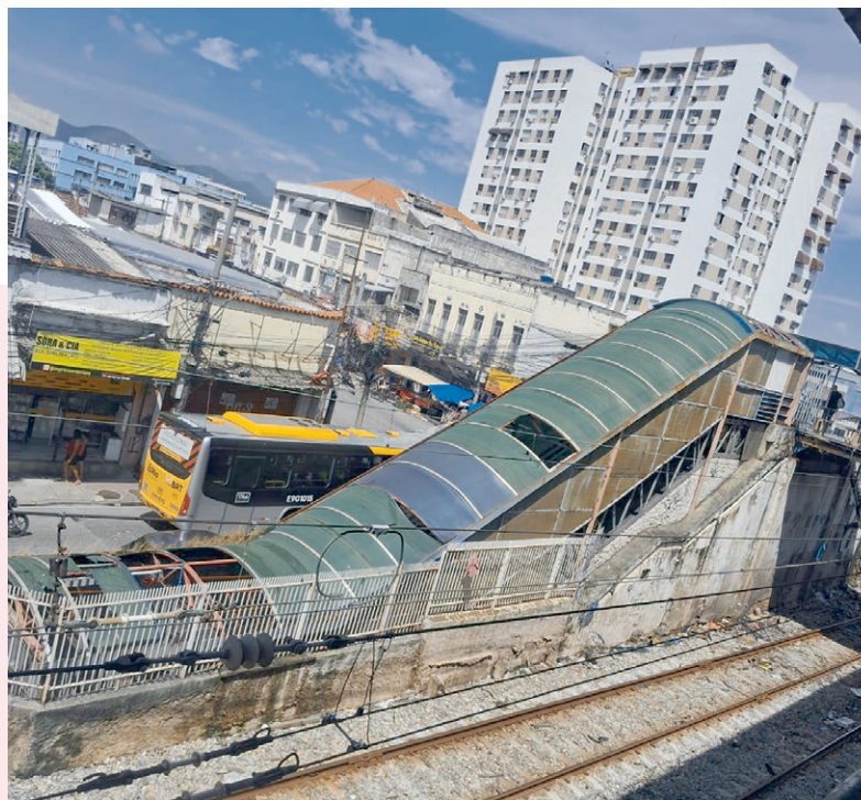
ENVIADA PARA O ZAP DO MEIA

Sallim Solução Via ZapZap, o WhatsApp do Meia Hora