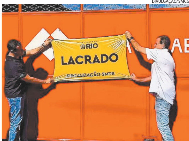
Eduardo Paes (D) lacra garagem das Viações Real e Vila Isabel

“Só para vocês terem um número: dos 250 ônibus que essas empresas botam na rua, ontem [sexta-feira] só tinham 17 circulando”, comentou o