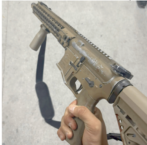
Um dos quatro fuzis do bonde do Doca, do CV