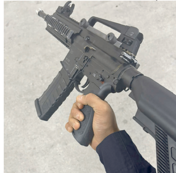
Policial militar exibe um dos fuzis apreendidos