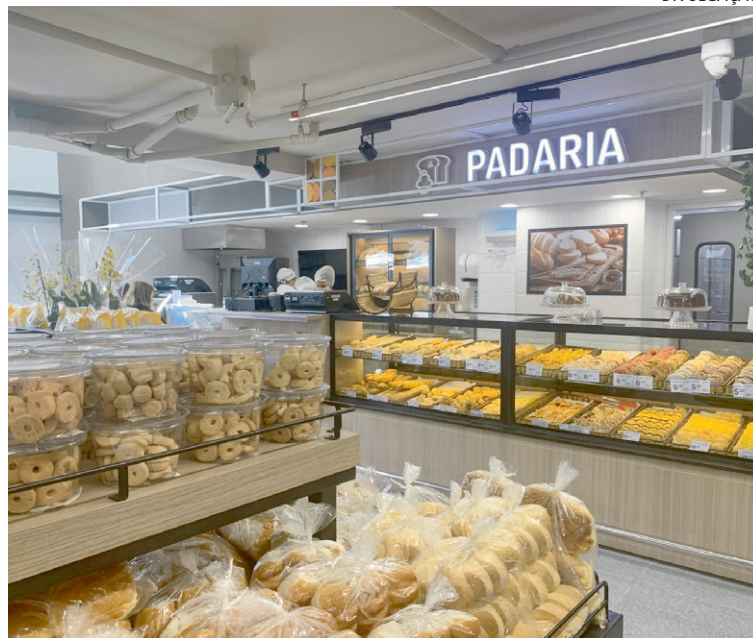
Ao todo, são 60 vagas de Fiscal de Prevenção de Perdas e 20 para PCDs

9h, na Rua Camaragibe, 25, Tijuca (próximo ao Tijuca Tênis Clube), com distribuição de até 25 senhas. Para essas vagas, é exigido o ensino médio completo ou incompleto. Todos os candidatos devem apresentar documento de identidade, CPF e Carteira de Trabalho (física ou digital), sendo que PCDs também precisam levar laudo médico que comprove a condição.