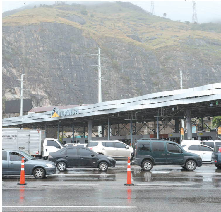
Policial penal foi assassinado próximo à praça do pedágio